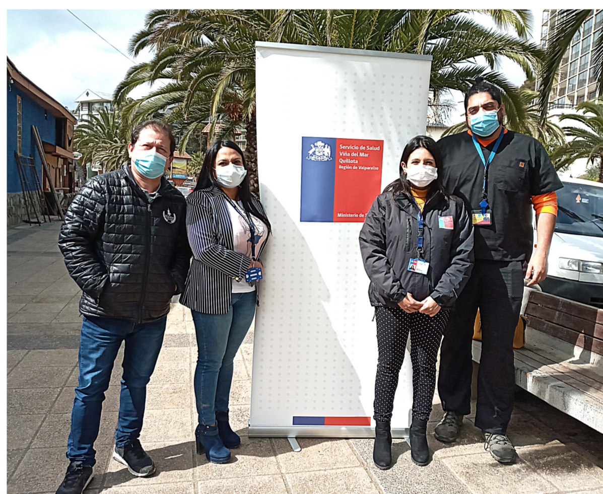
En Papudo el equipo trabaja con un enfoque integral.