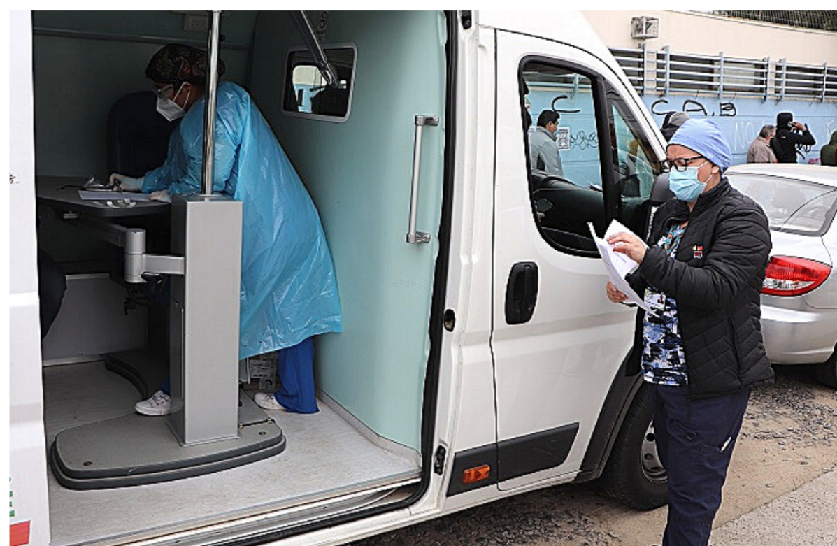
Operativo de toma de PCR en Quilpué.

Lo que ha quedado claro, advierte, es que habrá que cambiar paradigmas y la forma tradicional como enfrentábamos las problemáticas sanitarias: "Paradigmas en los horarios de atención, en las formas de atender. Creo que es una oportunidad para fortalecer la salud familiar, implementar el modelo de multimorbilidad, que permite que el adulto sea visto en mayor tiempo, pero con todas sus patologías en una sola consulta y de esa manera, se evita el exceso de fármacos y una atención más integral a partir de sus determinantes sociales. Se agrega la necesidad de fortalecer la atención en el domicilio, entregando carteras de atención a todos los integrantes de una familia, evitando el traslado, a veces dificultoso, a centros de salud".