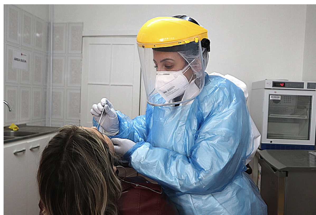
Operativo de toma de PCR en Olmué.